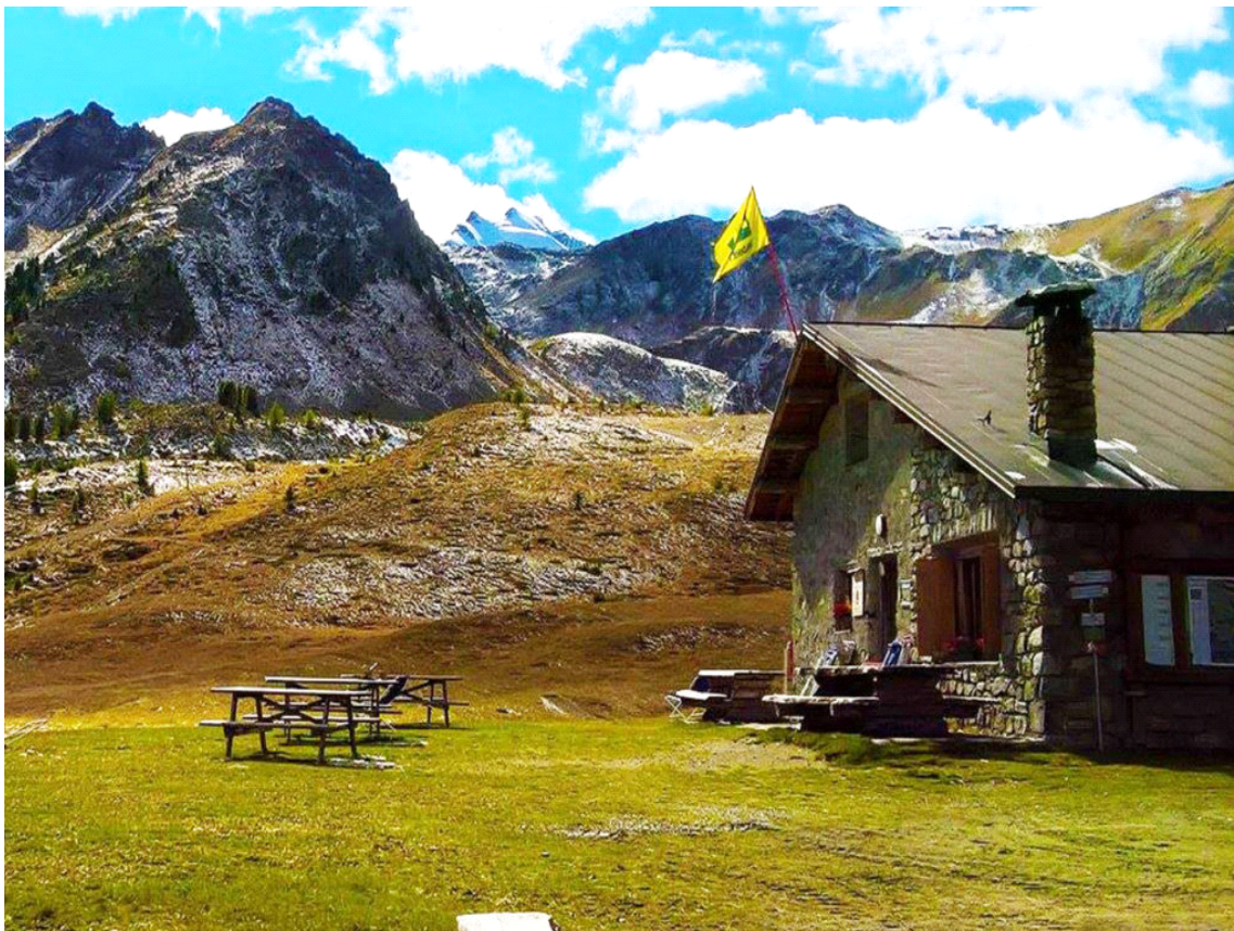
Malga San Colombano

Il presente servizio ha esclusivamente finalità informativa. www.valtellinaoutdoor.it non assume alcuna responsabilità per eventuali danni legati alle attività escursionistiche ed allo stato dei percorsi. Si consiglia di consultare il Bollettino Meteo prima di ogni escursione.